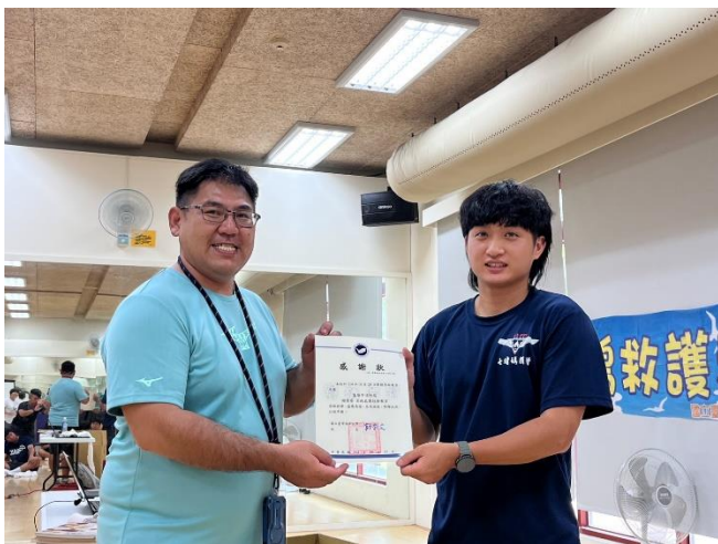
致贈感謝狀-急救教育教官