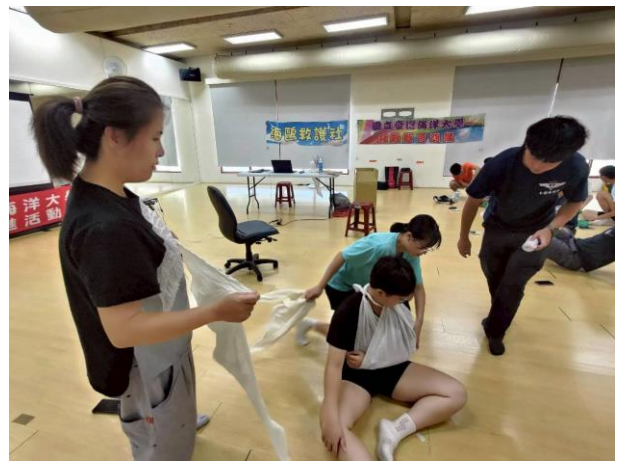
分組操作練習-三角巾包紮固定