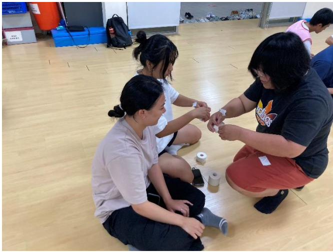
指導貼布撕貼技巧