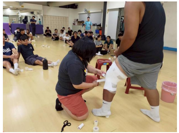
示範膝蓋部位防護貼紮