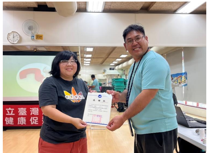
致贈感謝狀-運動防護講師