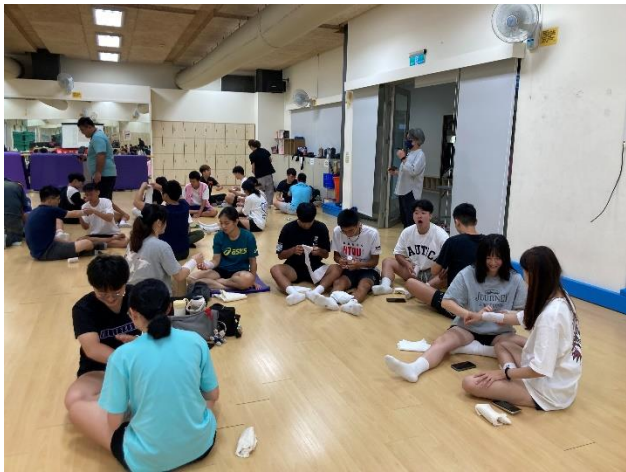
分組操作練習-彈繃包紮固定