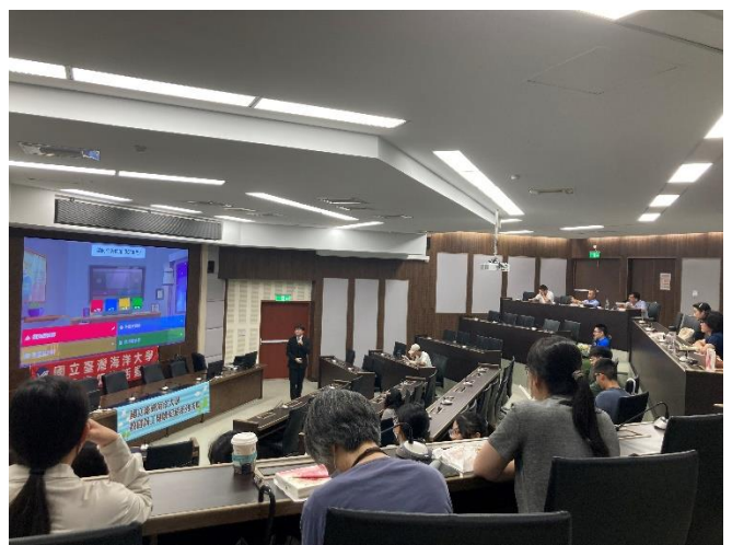
講師與學員的互動