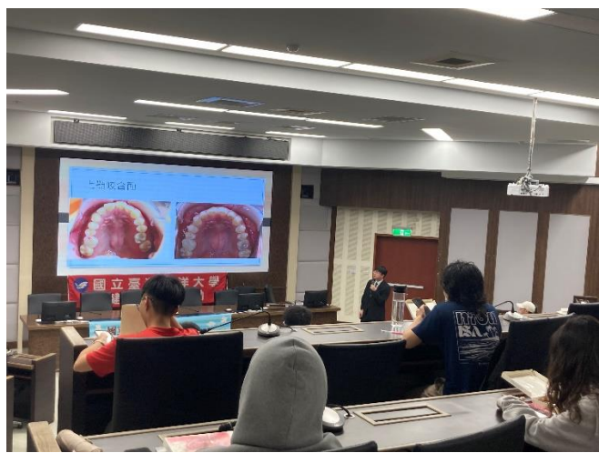
講師介紹「齒列與咬合面」