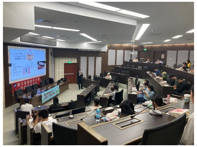
講述蛀牙→缺牙→補牙→植牙