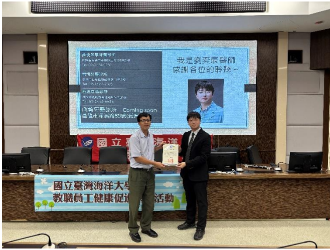
由衛保組宋組長頒贈感謝狀