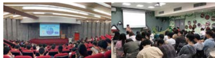
○ 2024 年 9 月心理健康日 ○ 自殺防治系列活動 ○ 動物輔助治療活動 ○ 諮輔週 - 牌卡諮詢體驗