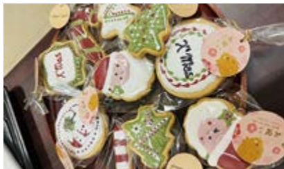
○ 2024 年 12 月 11 日耶誕造型餅乾烘焙工作坊