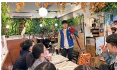
○ 2024 年 3 月 21 日校外參訪鸚鵡咖啡館