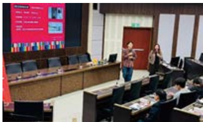
○ 2024 年 11 月 20 日酷兒電影賞析活動