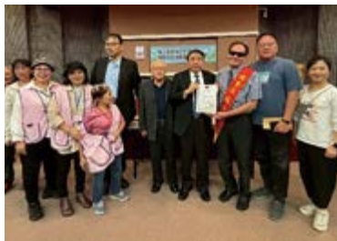
○教職員舒壓按摩活動