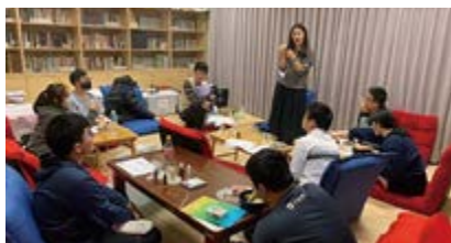
○ 2024 年 3 月 5 日精油療癒身心紓壓團體