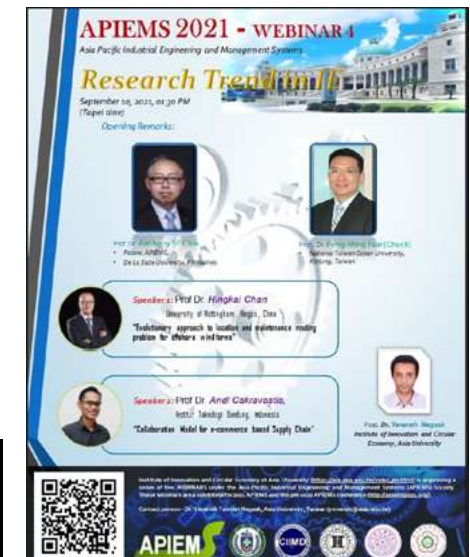
▲ The 29th International Society for Business Innovation and Technology Management 會議海報