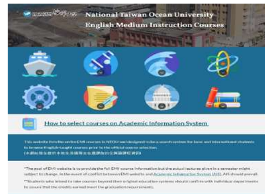
▲ 新設全校 EMI 課程查詢網站