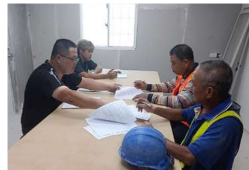
▲ 校區承攬作業巡檢