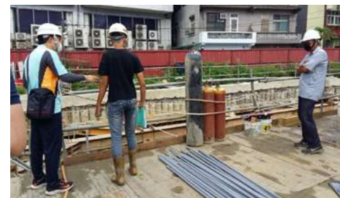
▲ 配合北區勞檢單位進行本校新建大樓工地安全檢查