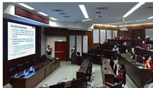
▲ 年度承攬作業協議組織會議暨安全衛生管理宣導

組立「承攬商協議組織」LINE 群組，於群組進行相關資訊佈達，並不定期於群組分享職災新聞，提升各廠商工作夥伴安全意識與法規觀念。