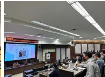
▲ 馬祖校區心理衛生宣導