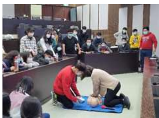
▲ 學生急救教育訓練