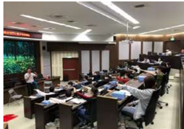
▲ 自殺防治系列活動

本校諮商輔導組負責提供各種心理健康與生涯發展的輔導和服務，針對同學在學校生活中，可能面臨的各種學習、人際、心理發展課題，規劃多種體驗課程與活動，協助學生學習情緒調適、培養健康抒壓管道，建立充足之心理衛生知識與自我照顧能力，預防校園憂鬱與自我傷害。透過結合「服務學習-愛校服務」辦理6週「大一學習促進課程」、實施新生心理健康篩檢、心理衛生活動、導師知能會議等，以強化學生支持系統，加強心理衛生三級預防工作，營造友善校園氣氛。