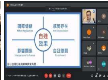
▲ 自殺防治系列活動 - 導師輔導知能