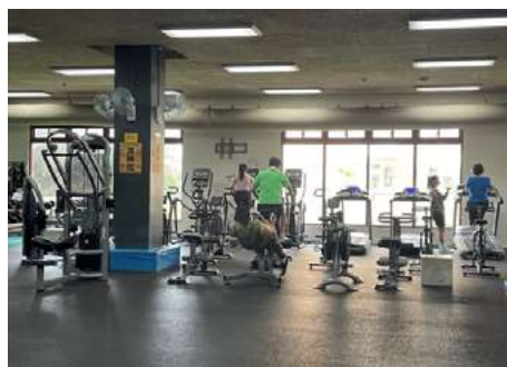
▲ 教職員健康促進活動場地使用情形