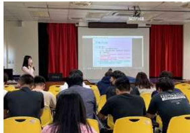
▲ 性平宣導系列活動