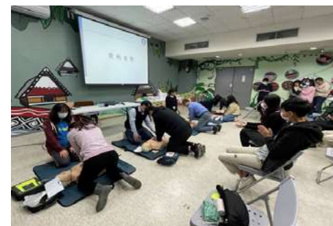
▲ 教職員急救人員教育訓練